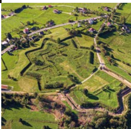
Historické opevnění Šance