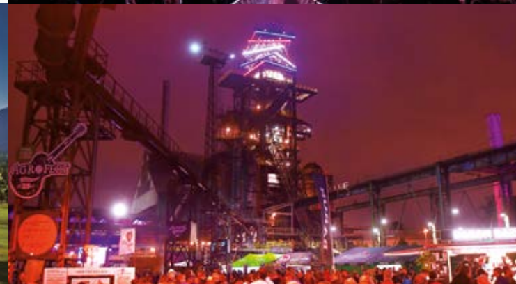
Colours of Ostrava