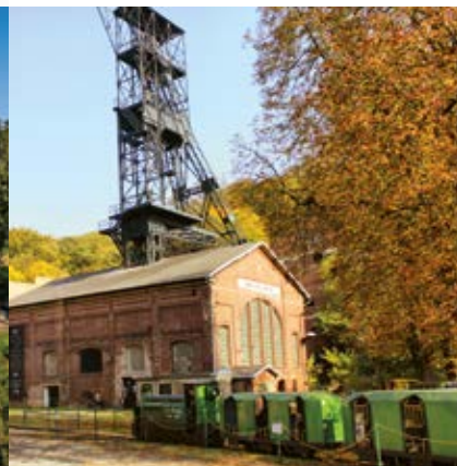
Hornické muzeum Landek Park